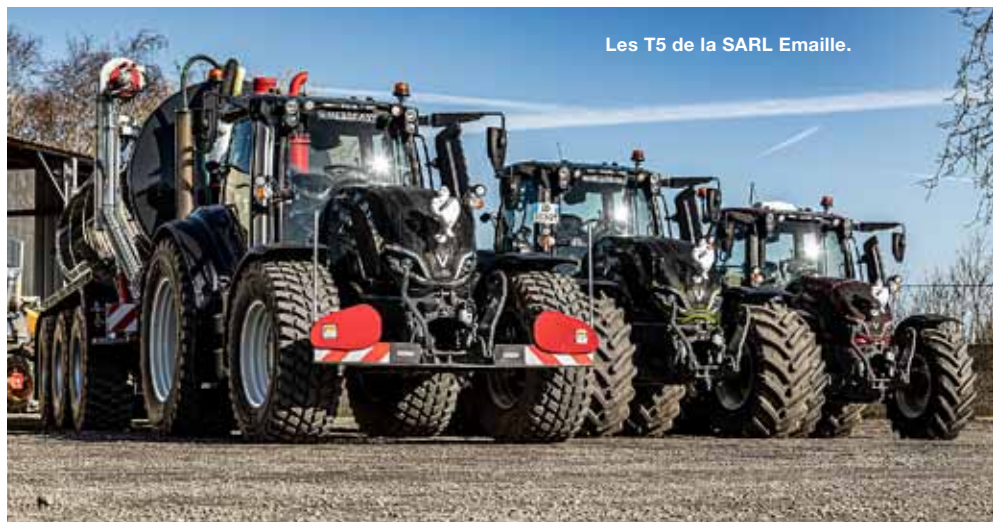
Les T5 de la SARL Emaïlle.

ils avaient besoin de plus de puissance mais une utilisation qui ne nécessitait pas la finition Versu avec la présence de l'écran SmartTouch. Il possède néanmoins un écran un SmartTouch Extend dans ses Active pour gérer les outils en liaison Isobus et les activités nécessitant l'autoguidage.