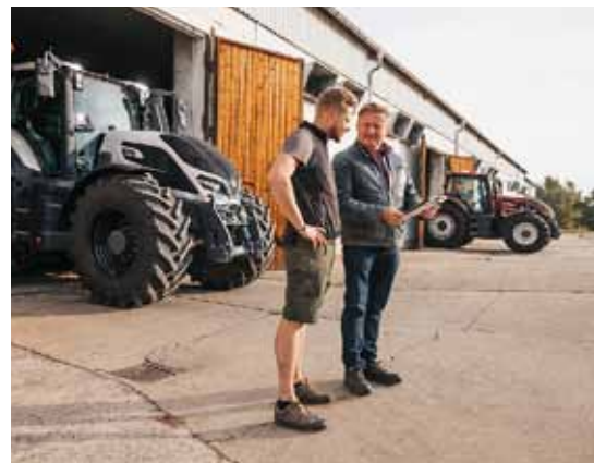
Les clients de la Série Q ont la garantie d'un excellent service de pièces détachées et d'entretien, et d'assistance.

« Par exemple, avec l'autoguidage Valtra Guide associé à la gestion automatisée des manœuvres