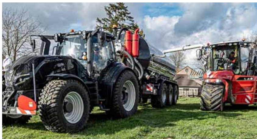
Le T5 Active et l'automoteur.