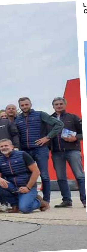
Les interlocuteurs Valtra de la région Est qui ont suivi une formation Q5 à Hautevesnes (Aisne) !