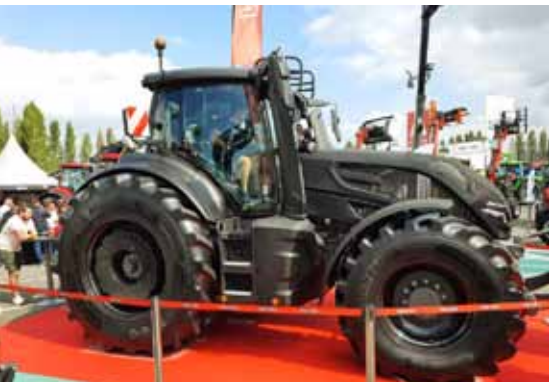
La Série Q fait son show au SPACE !

La saison des salons s'est terminée par notre présence au SIMA du 6 au 10 novembre, le Salon International du machinisme qui s'est déroulé à Villepinte avec l'unique présence de notre grande Série Q ! •