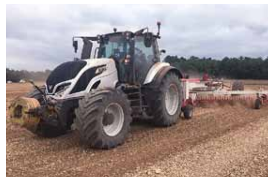
Le T235 en action !

Le choix de son concessionnaire, tout nouvellement rebaptisé D&R