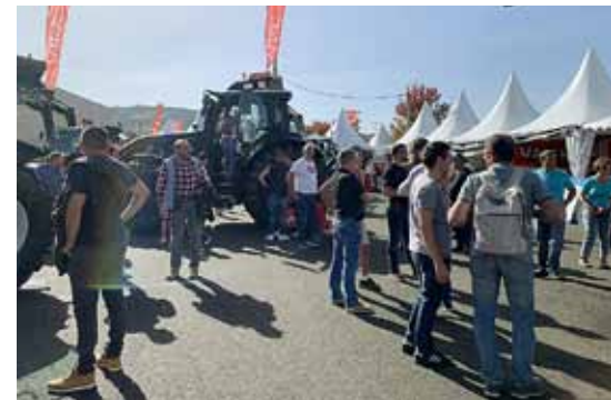
Village concessionnaire au Sommet de l'Elevage.