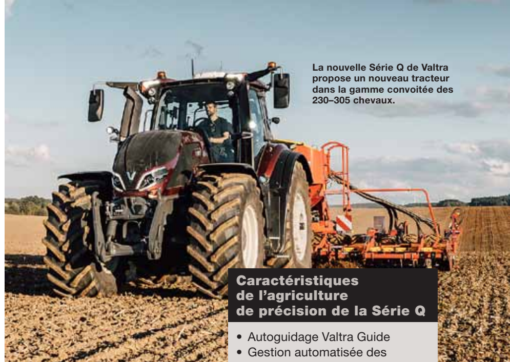
La nouvelle Série Q de Valtra propose un nouveau tracteur dans la gamme convoitée des 230-305 chevaux.

« La Série Q fixe également un certain nombre d'exigences élevées aux concessionnaires. Les techniciens doivent suivre une formation, une gamme déterminée de pièces