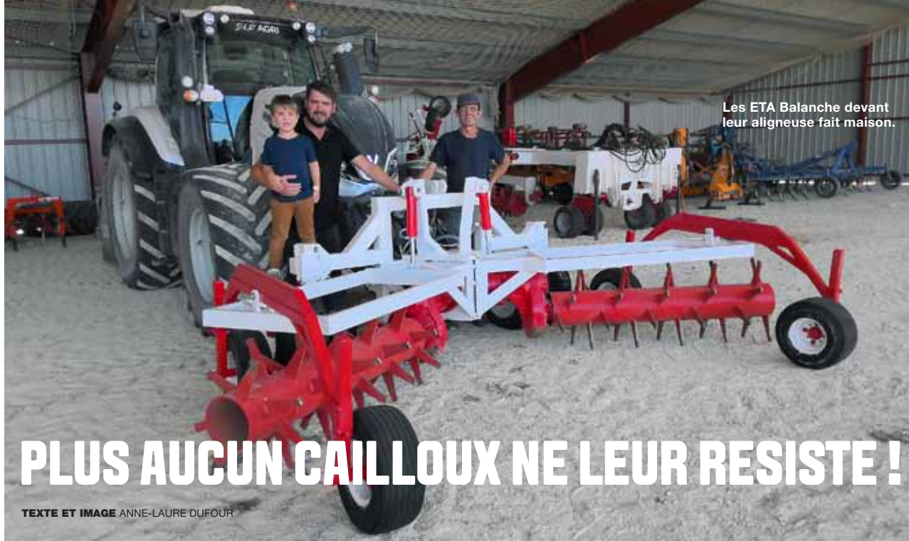
Les ETA Balanche devant leur aligneuse fait maison.