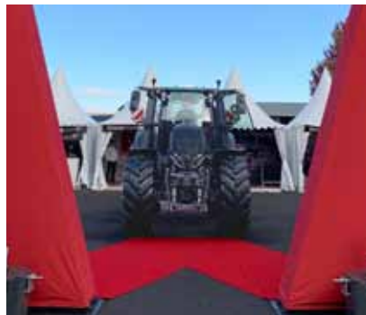
La nouvelle Série Q au Sommet.

En effet, c'est à Innov-Agri que notre nouvelle Série Q a fait son apparition au grand public sous une belle couleur Unlimited Black Matt. Certains d'entre vous ont eu la chance de tester son confort avec sa suspension pneumatique AIRES