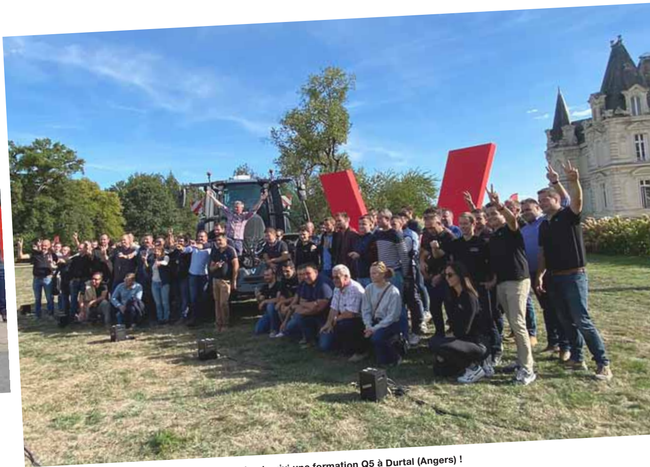
Les interlocuteurs Valtra de la région Ouest qui ont suivi une formation Q5 à Durtal (Angers) !